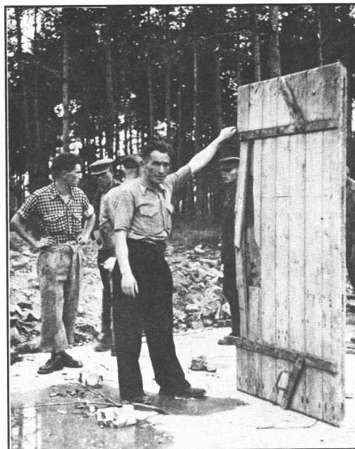
Document 2 : Porte étanche au gaz retrouvée presque intacte dans la partie ouest du crématoire V.